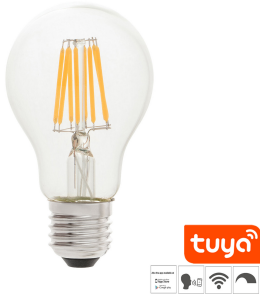
Glühbirne A60 E27 7W 2700K TUYA WIFI